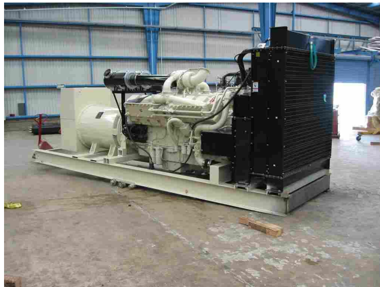
I.- MOTOR 600G14